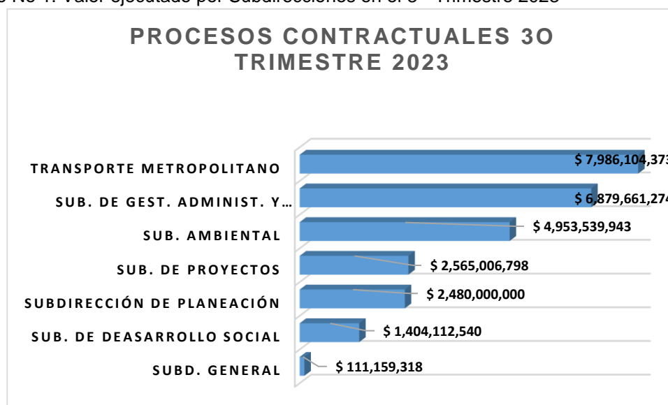
Gráfico No 1: Valor ejecutado por Subdirecciones en el 3º Trimestre 2023